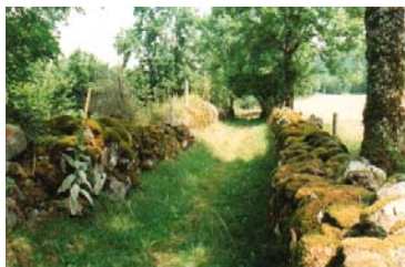
Chemin Izergues, Cantal

« Rues et Chemins » sera le thème de la prochaine édition de la Journée du Patrimoine de Pays, qui fêtera ses 10 ans le dimanche 24 juin 2007 .